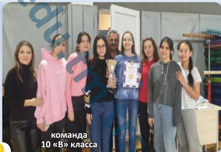
команда 10 «В» класса