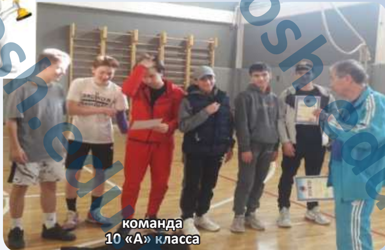
команда 10 «А» класса