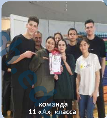
команда 11 «А» класса