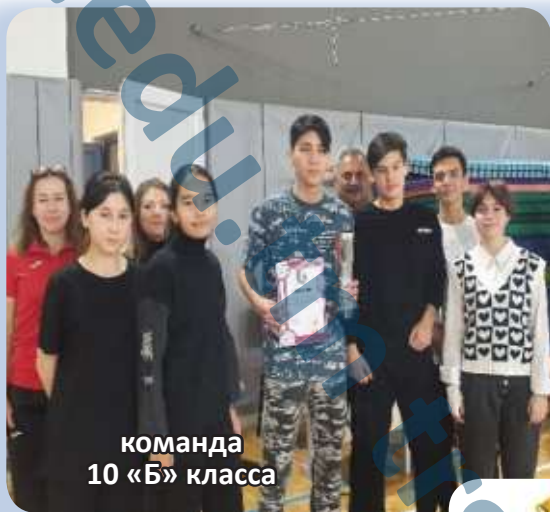
команда 10 «Б» класса

Награждение победителей и призеров соревнований состоялось в спортивном зале школы. Им были вручены переходящий кубок школы, грамоты и памятные подарки.