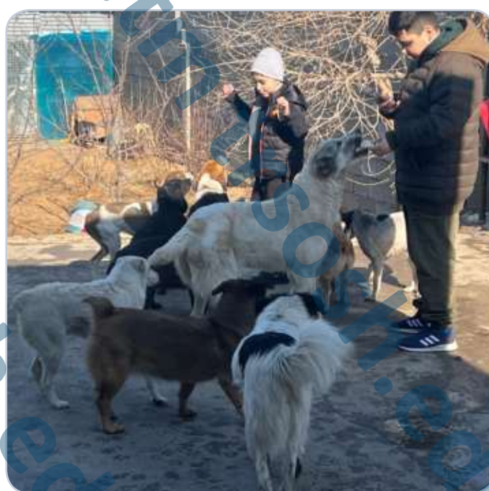
Пресс - центр 5«Б»класса.