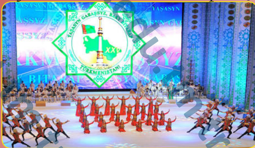
День Независимости Туркменистана