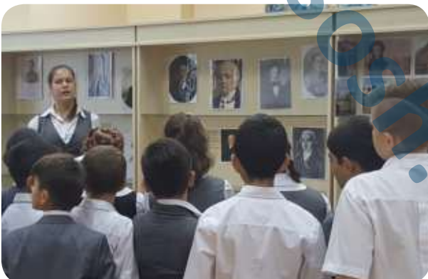
пресс-центр 8 «А» класса