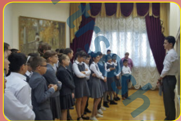
Мы вам расскажем...