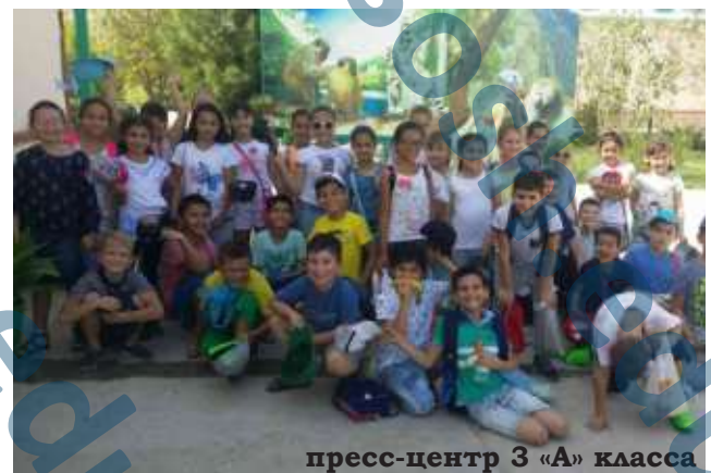
пресс-центр 3 «А» класса