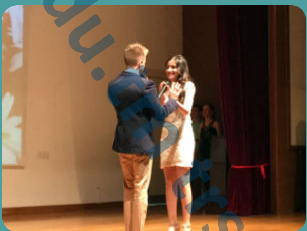
Ты + Я