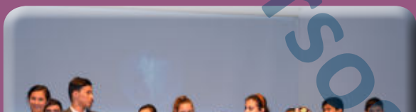
конкурс "Звездный дождь"