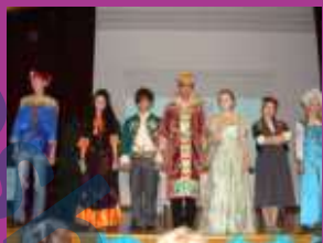
Сказка про Федота- стрельца