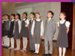
Отчетные концерты по хору и танцам