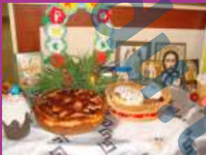
Конкурс пасхального стола