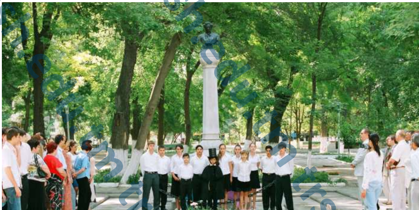
У памятника А.С.Пушкина в Ашхабаде 6 июня

В 2009 году в школе был открыт музей имени А.С.Пушкина, который стал местом притяжения не только для учащихся и преподавателей, но и для наших многочисленных гостей.