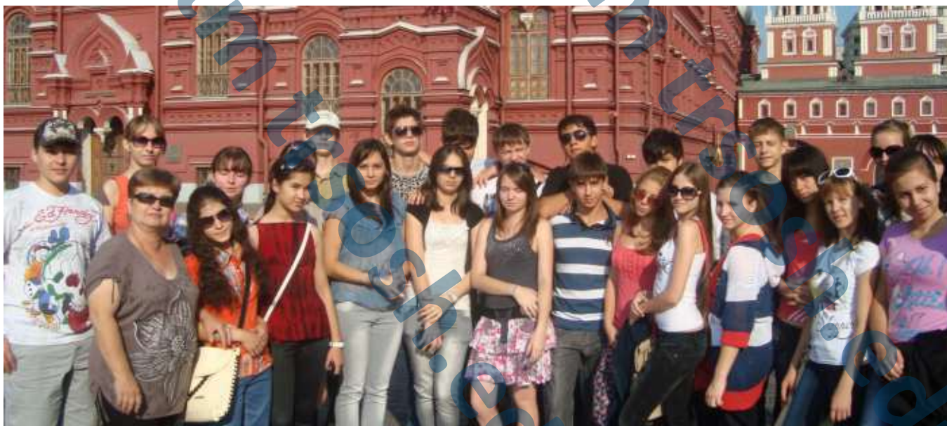
Путешествие по Золотому кольцу России