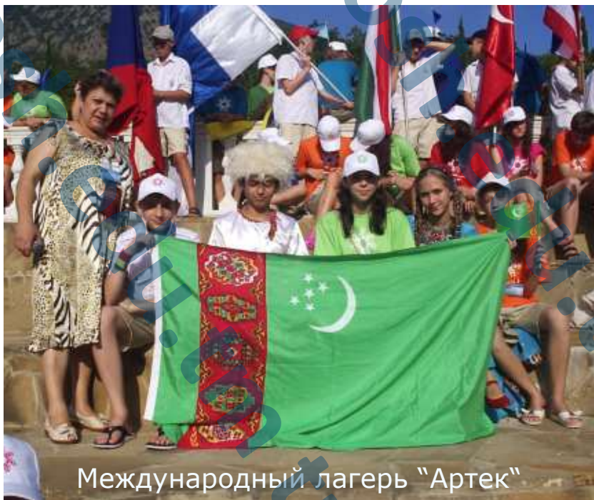
Международный лагерь "Артек"

Каждый год расширяется география поездок учащихся СТРСОШ, которых школа делегирует для участия в международных фестивалях, смотрах, олимпиадах, конференциях. Как правило, домой наши представители всегда возвращаются с наградами и дипломами лауреатов. Такая школьная дипломатия позволяет наладить тесные связи со сверстниками из разных стран.