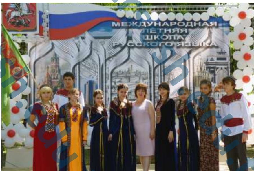
Международная летняя школа, русского языка "Московия"