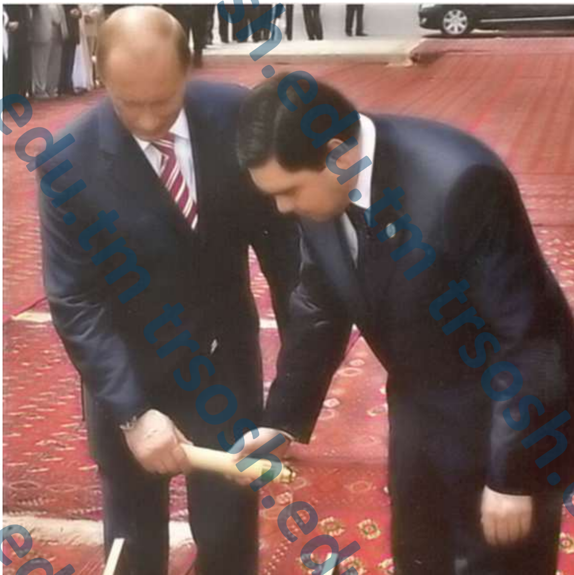
Закладка капсулы в фундамент нового здания совместной СТРСОШ имени А.С.Пушкина

Ровно 10 лет назад, 21 января 2002 года, подписано Межправительственное Соглашение между Туркменистаном и Российской Федерации об открытии в г. Ашхабаде совместной, туркмено – российской средней общеобразовательной школы имени А.С.Пушкина. Именно с этого дня идет отсчет деятельности нашей школы. По замыслу её создателей – глав двух государств - школе была предопределена особая миссия: на основе лучших традиций туркменской и русской культур воспитывать поколение молодёжи, способной преумножить и обогатить эти традиции на основе современных знаний и приверженности исконным и духовно-нравственным ценностям.