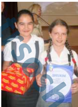
5 «в» Победители конкурса

Всем участникам дали грамоты так, что никто не ушел обиженным. А победителями конкурса стали ученики 5«В» они получили призовую грамоту и торт.