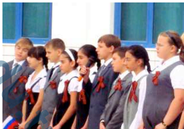
На линейке к 9 мая

Ветераны Великой отечественной войны! Желаем вам крепкого здоровья, теплоты сердец, мирного неба над головой.