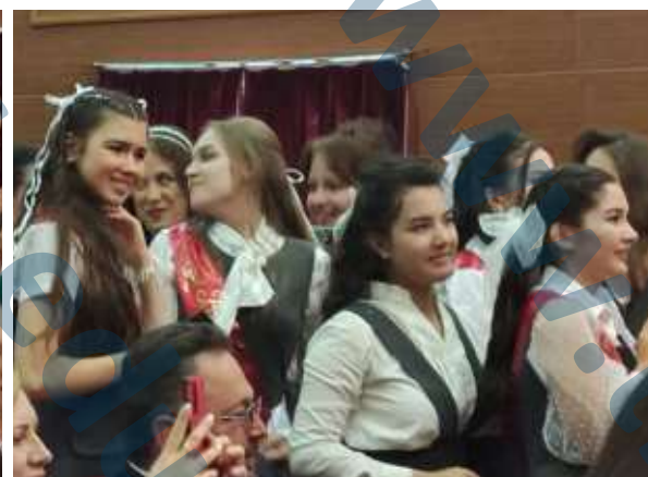
Одноклассники очень эмоционально поддерживали ребят!

Искренняя радость за друзей была запечатлена на фото «на память»