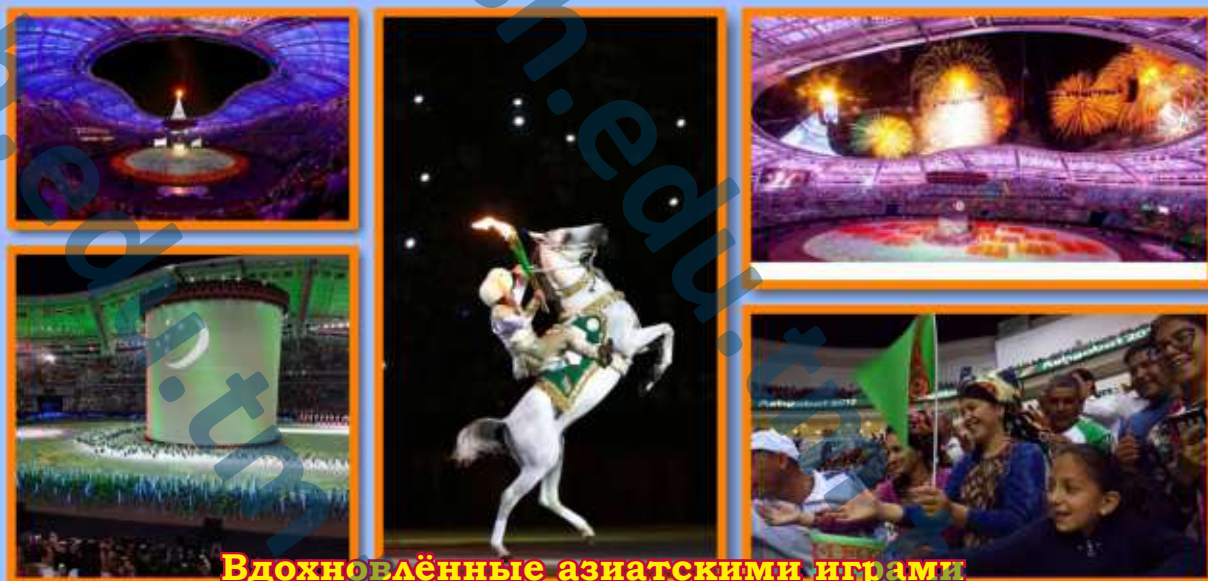
Вдохновлённые азиатскими играми

Открытие пятых Азиатских игр в закрытых помещениях и по боевым искусствам ждала вся наша страна. В Ашхабаде, на огромных экранах телевизоров, установленных в городе, шёл обратный отсчёт времени. И вот, настал торжественный момент. Открытие мы смотрели по телевизору, так как наши дети маленькие, и мы решили, что они могут устать. А потом мы купили билеты на самбо. Хотели ещё пойти на спортивные танцы, но билеты закончились очень быстро.