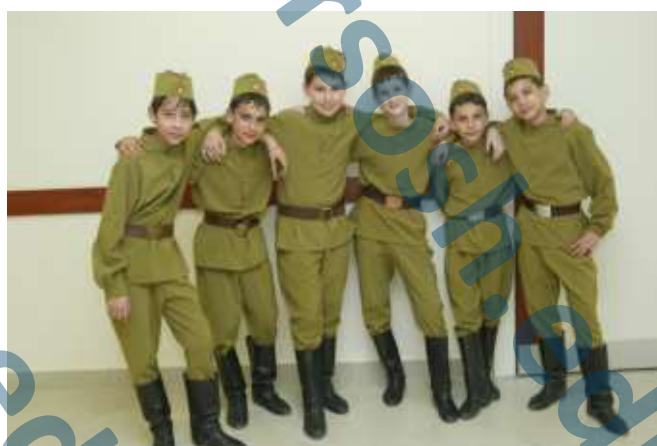
Праздничный концерт, посвященный Дню Победы.