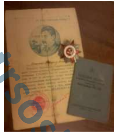
Андрей Кащенко, ученик 4 «В» класса

Я горжусь тем, что судьба моей семьи тесно переплетается с историей моей Родины, что военное поколение моей семьи с честью преодолело все трудности, выпавшие на долю советских людей.