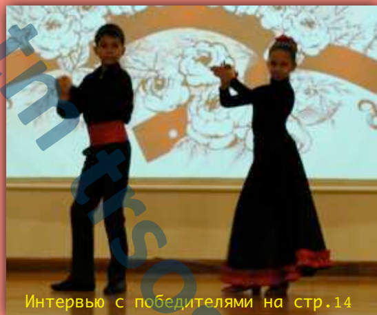
Интервью с победителями на стр.14