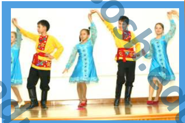
фотографии Николая Киреева