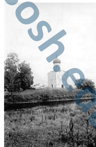
Храм Покрова на Нерли

Там же была и развлекательная программа в Костроме. А именно вечер у костра с приготовлением блинов.